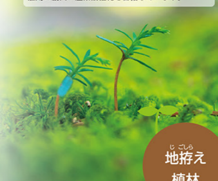
じこら 地植え 植林

持続林業を実現するため、私たちは木を植え、育てています。また、次代への資源と人材を確保・育成し、雇用の創出・産業活性化を目指しています。