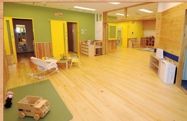
建築用資材から大型什器まで、木材を取り入れたあたたかい空間をご提案いたします。