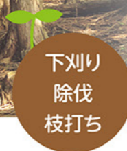
下刈り 除伐 枝打ち

私たちの森では、平均樹齢 50 年以上の樹木を保有しています。地域との連携・協業での管理のもとで育った、健康で上質な木材のご提供が可能です。